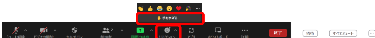
図6 手を挙げる方法