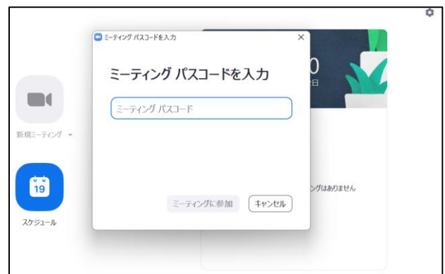
図2 ZOOM からミーティング ID とパスコードを入力して入室する方法