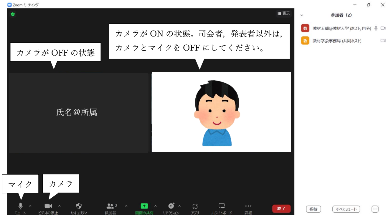
図3 ZOOM 会議室のイメージ